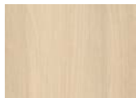
Acacia de Lakeland Crème