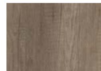
Chêne Nebraska Gris