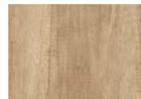
Chêne Nebraska Naturel