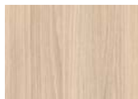
Chêne Vicenza Clair <NEW>