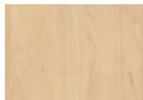
Erable Mandal Naturel